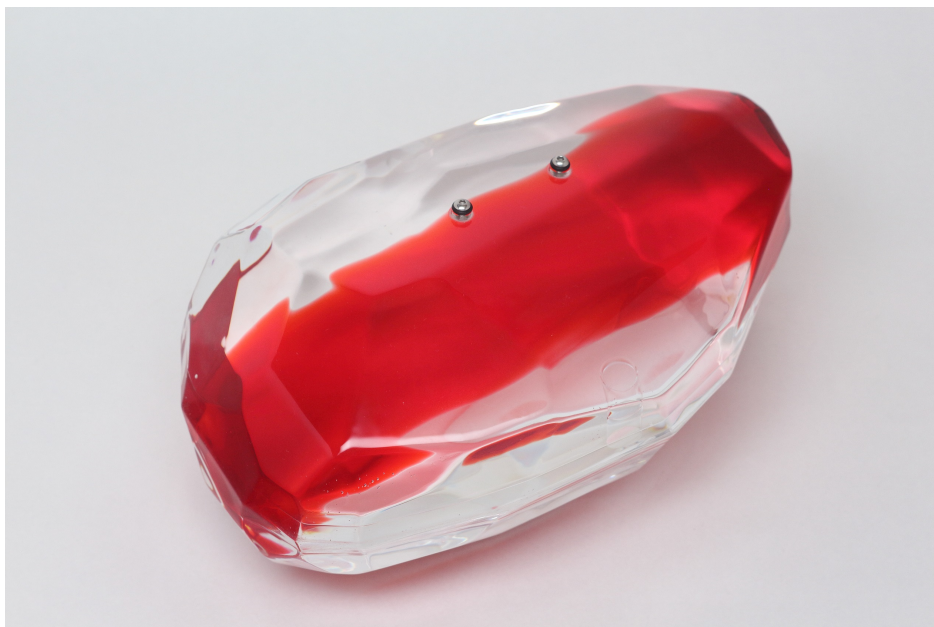
Untitled 2024 15×24×H12 cm Acrylic, glycerin

決して工業製品にはない温かみと、誰も思いつかなかったような新しい試み、着眼点を展覧会のたびにを見せてくれます。