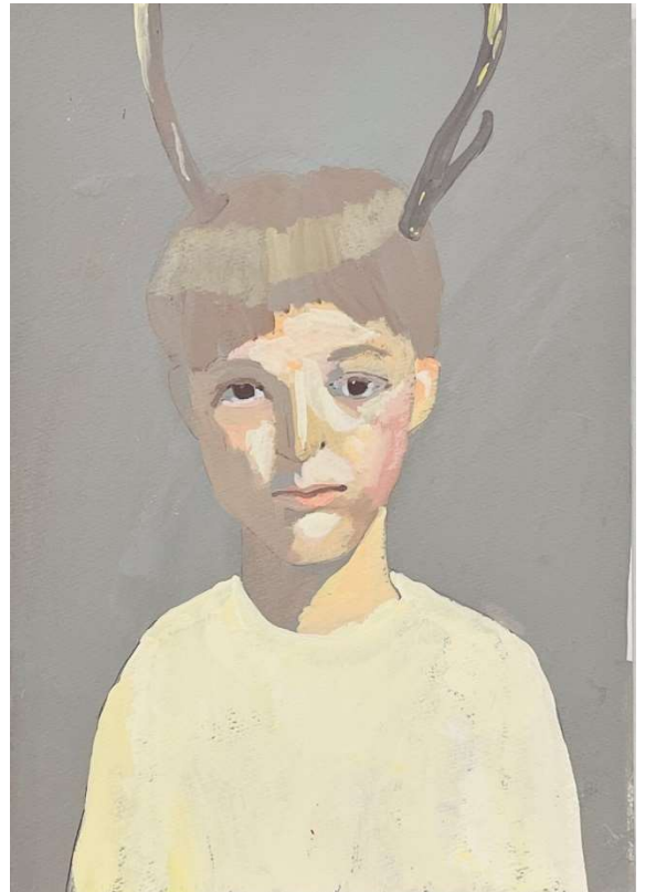
黒坂麻衣 Mai KUROSAKA Untitled 制作年不詳 29.7 x 20.7 (A4) アクリルガッシュ、紙 額付