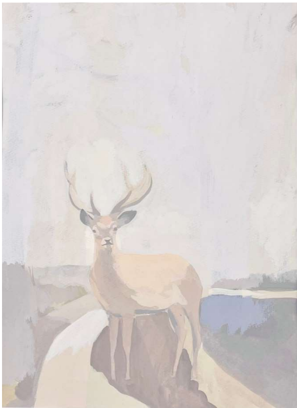
黒坂麻衣 Mai KUROSAKA Untitled 制作年不詳 33.5 x 24.5 (B4) アクリルガッシュ、紙 額付