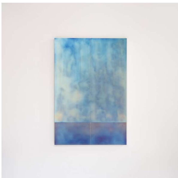
Fragment239_20 2023 h555×w375mm Titanium