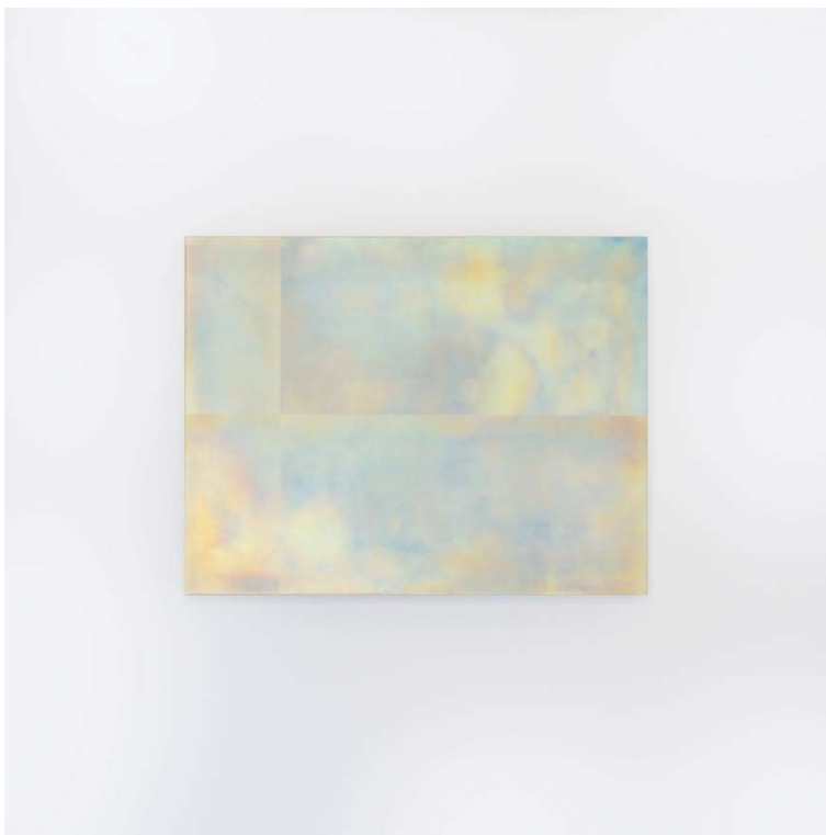
fragment237_15 2023 h375xw486 mm Titanium