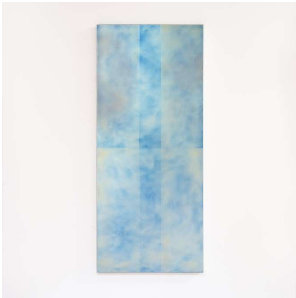
fragment239_21 2023 937x364 mm Titanium