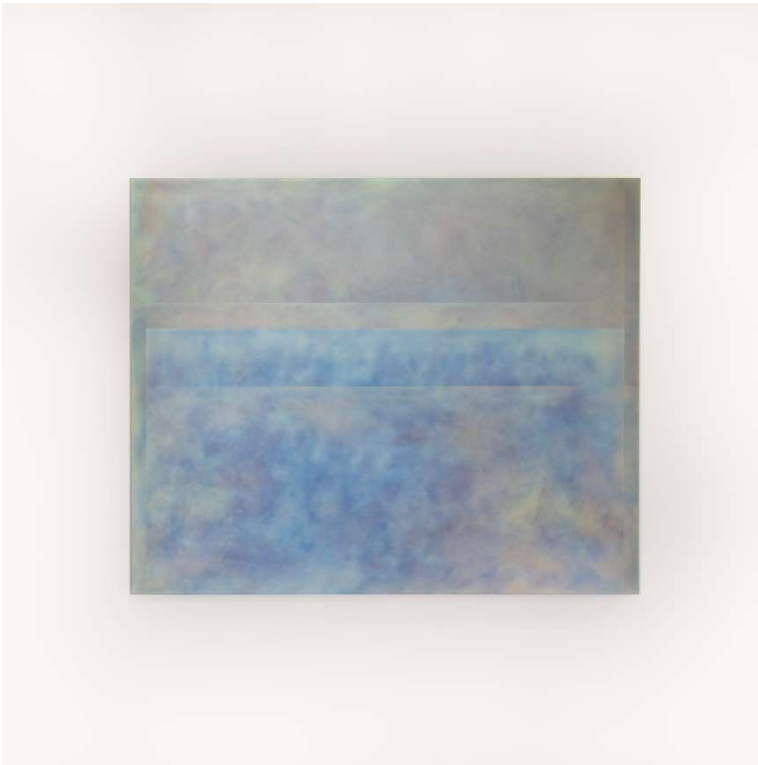
fragment2310_24 2023 h500×w610mm Titanium

Yanagida's works allow the viewer to enjoy color changes depending on natural light, lighting, and the angle from which they are viewed.