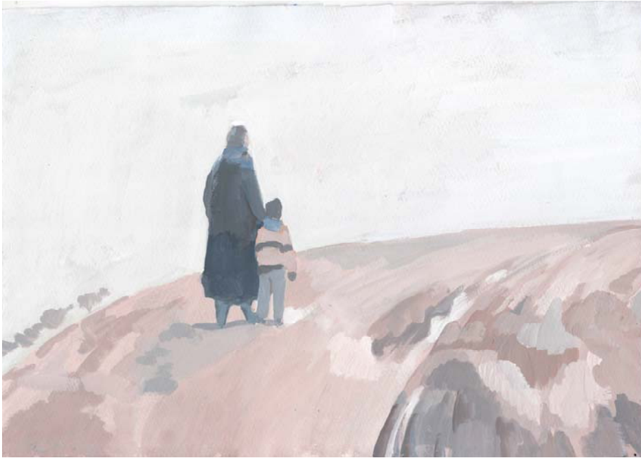
Wind 2016 210x297 mm 紙にアクリルガッシュ