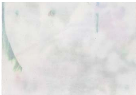
菊池史子 「witness#2」 Mono Type Print 2014